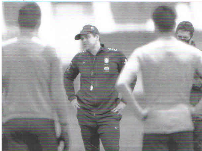
Dos 50 nomes pré-convocados, o treinador da Seleção Brasileira poderá contar com apenas 18 jogadores para os jogos no Japão

ton (Palmeiras), Santos (Athletico-PR), Gabriel Brazão (Real Oviedo), Brenno (Grêmio), Ivan (Ponte Preta) e Cleiton (Red Bull Bragantino)