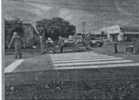
A sinalização horizontal traz segurança à sociedade

(Da Redação) Com o objetivo de organizar e dar segurança às vias públicas de Rondônia, o Departamento Estadual de Trânsito (Detran) subsidiou recursos financeiros para a implantação de sinalização horizontal, vertical e de indicação de ruas do município de Vale do Anari, por meio de convênio com a prefeitura, no valor de R$ 701 mil.