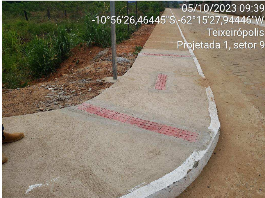
FIGURA 3 – Piso Tátil na Rua Projetada 01 (Setor 09)

PREF. MUNICIPAL DE TEIXEIRÓPOLIS (Contratante)