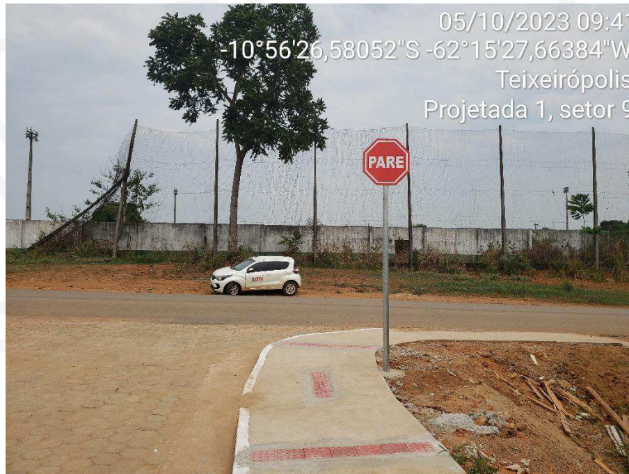
FIGURA 5 – Placa na Rua Projetada 01 (Setor 09)

PREF. MUNICIPAL DE TEIXEIRÓPOLIS (Contratante)