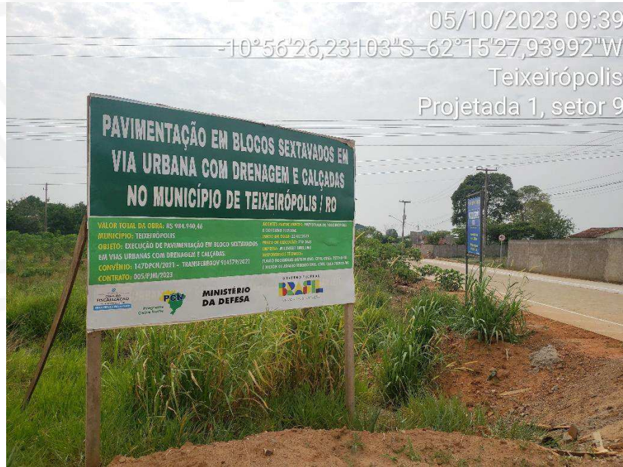
FIGURA 1 - Placa de obra