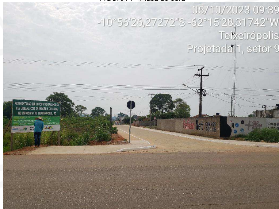
FIGURA 2 – Rua Projetada 01 (Setor 09)