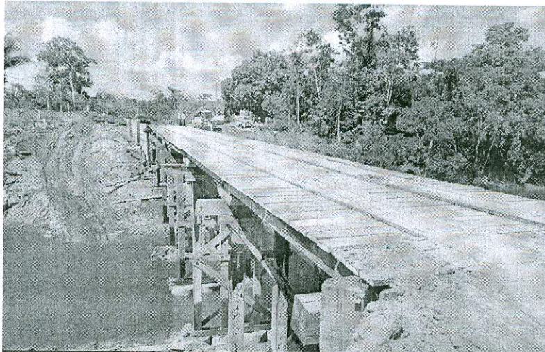
A travessia é de grande porte e possui 50 metros de comprimento por cinco metros de largura

(Da Redação) A Prefeitura de Jaru, concluiu a construção da estrutura principal da nova ponte sobre o rio São Domingos na linha 628.